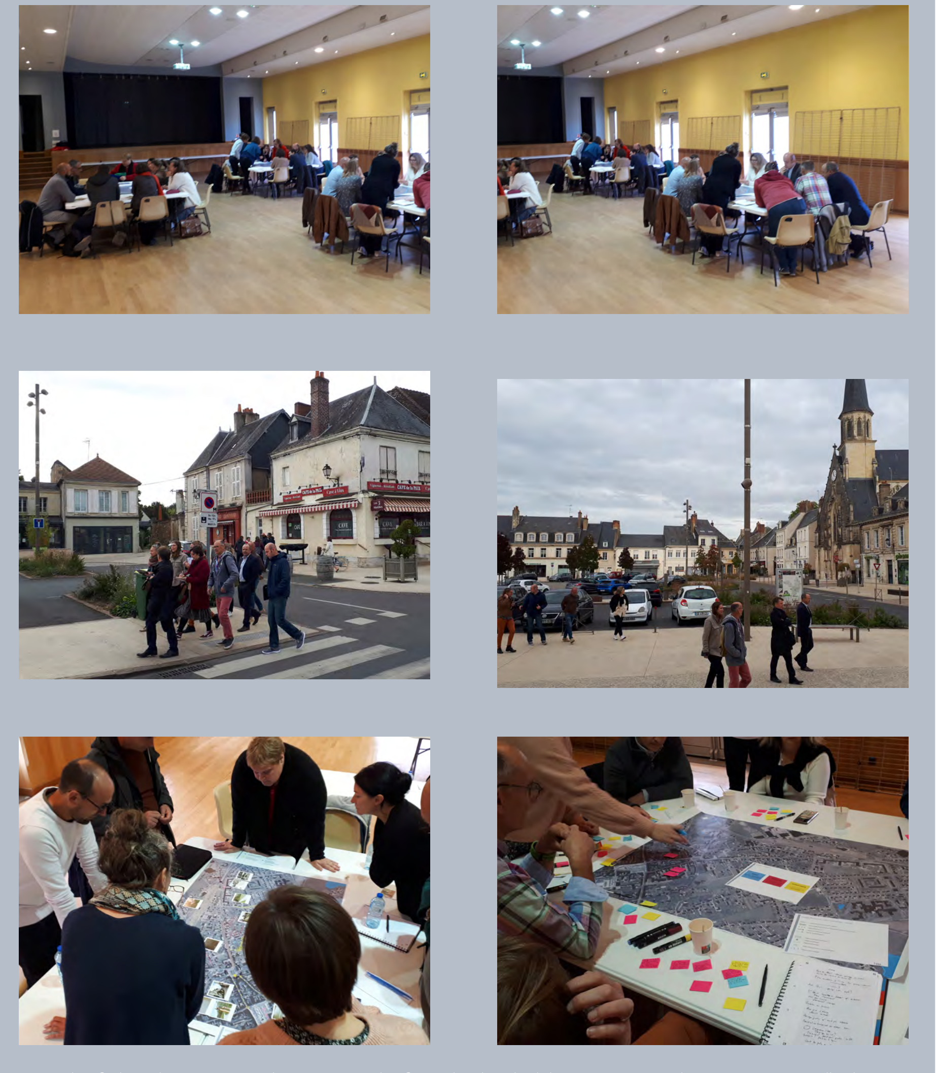
Les ateliers BozBoz - diagnostic en marchant et groupes de réflexion dans le cadre de l'accompagnement du programme Petites Villes de Demain