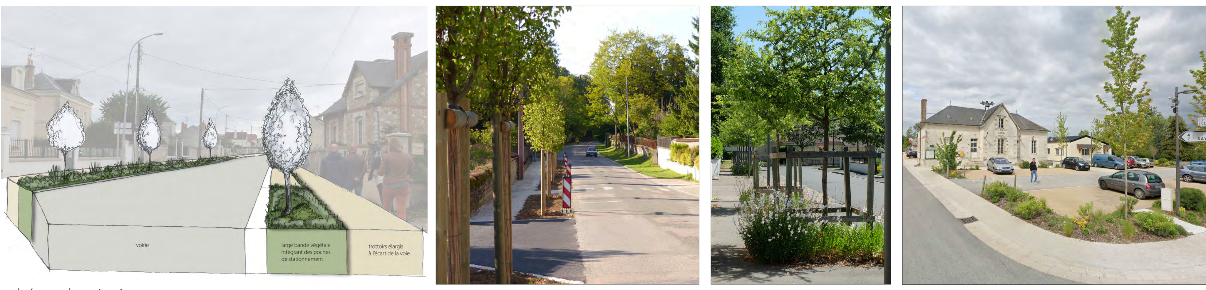
schéma de principe > Qualification de l'Avenue et confort des usages piétons