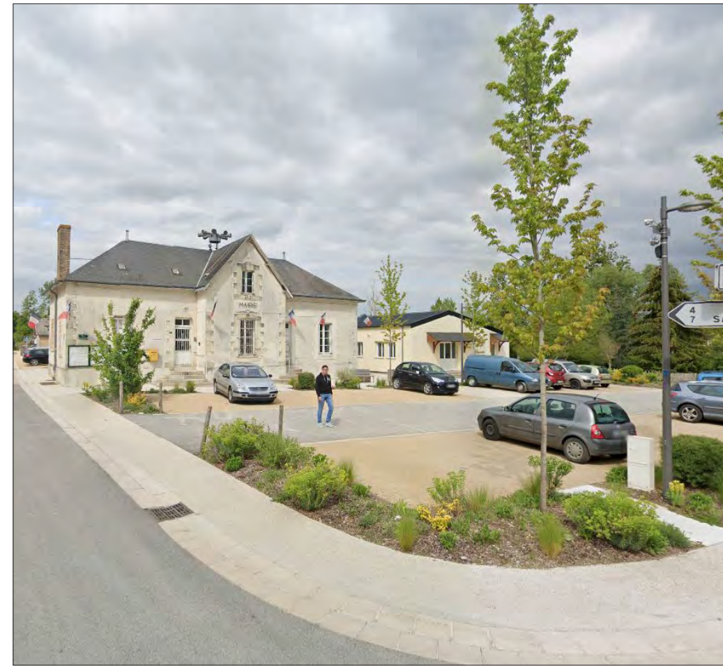
> Végétalisation de l'Avenue Gambetta et des abords de la place Clémenceau