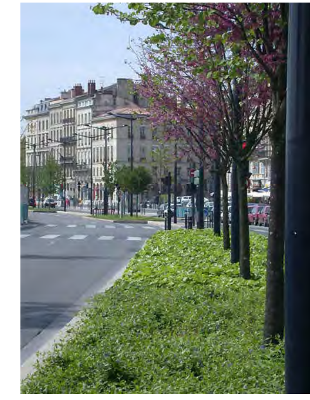
Végétalisation des pieds d'arbres : une large bande de couvre-sol protège les arbres jouxtant la rue.