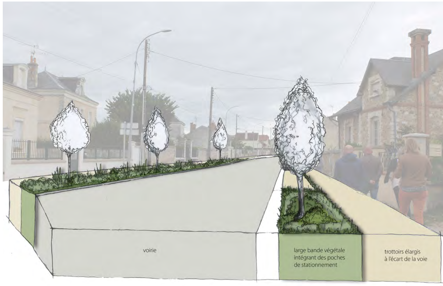
schéma de principe > Qualification de l'Avenue et confort des usages piétons