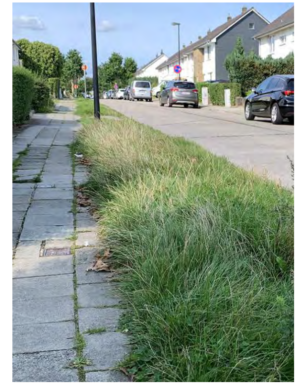
Bande enherbée séparant la voirie de l'espace piéton. Absorption des eaux de ruissellement de la chaussée.