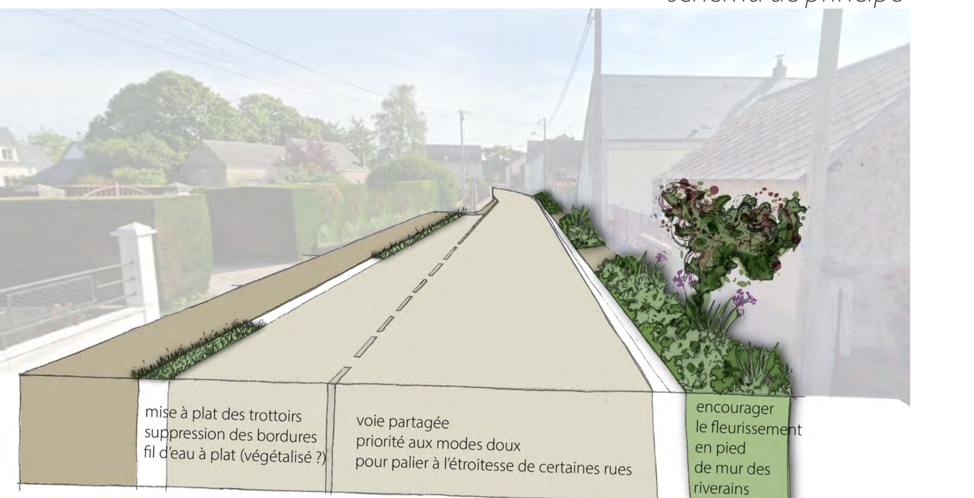
schéma de principe