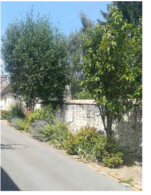
Massifs en bande. Les vivaces protègent les pieds d'arbres.