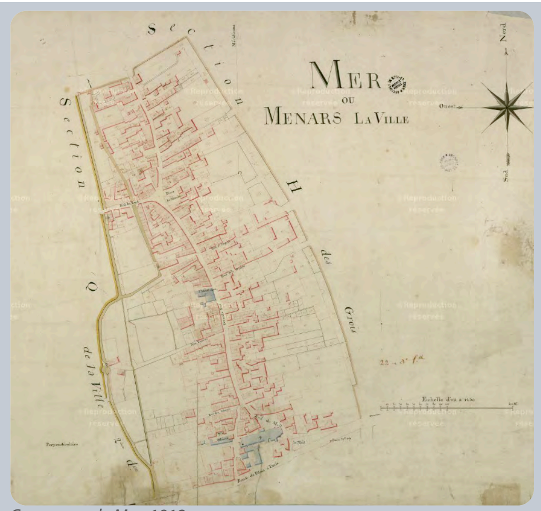
Commune de Mer, 1812