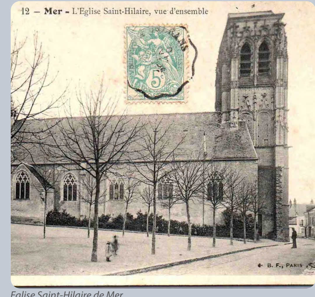
Eglise Saint-Hilaire de Mer