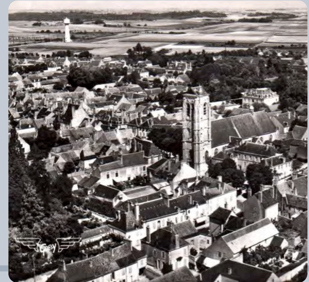
Vue aérienne du centre-ville de Mer, point de vue de l'église Saint-Hilaire