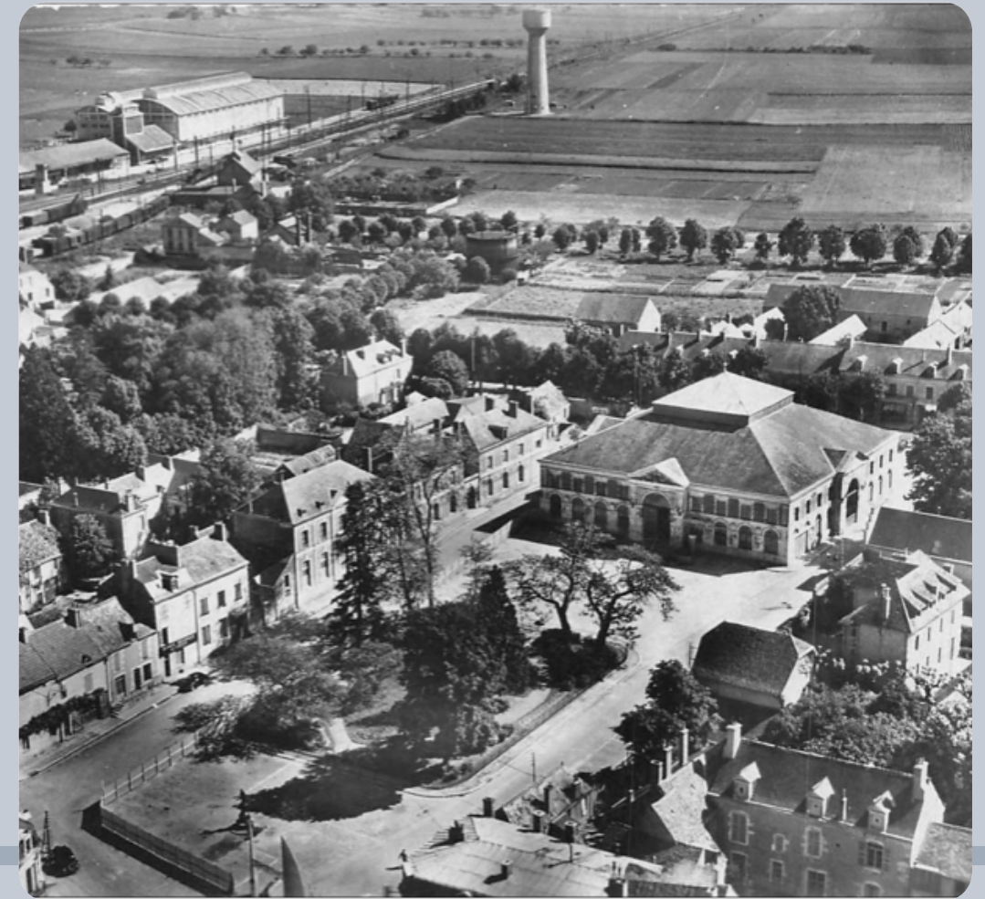
Vue aérienne du centre-ville de Mer, point de vue de la Halle aux grains