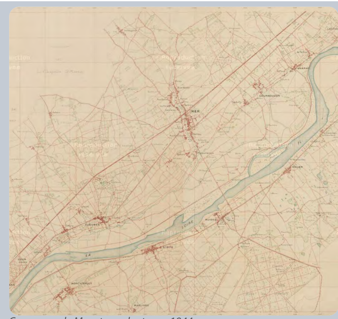
Commune de Mer et ses alentours, 1944

> DONNER À VOIR, FAIRE CONNAÎTRE ET VALORISER