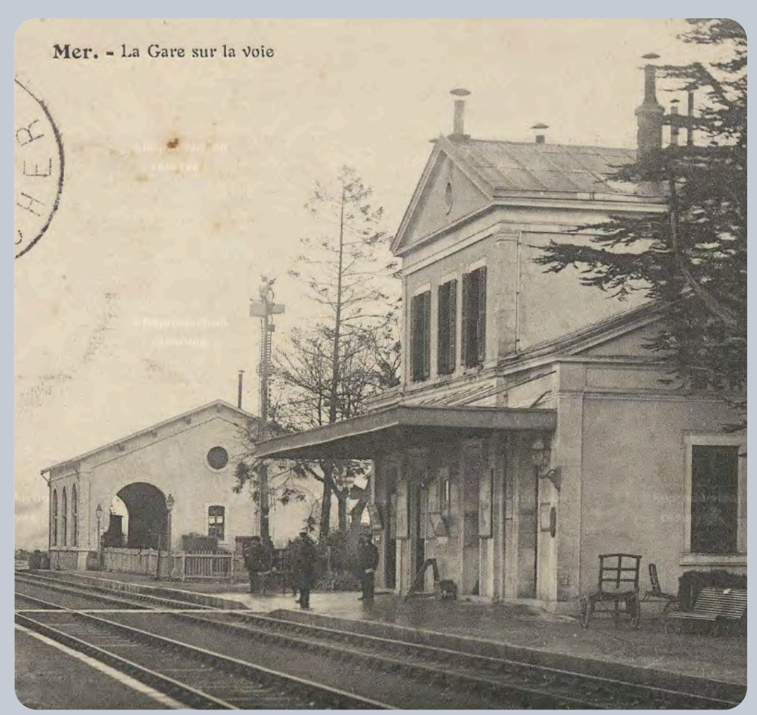
Gare de Mer