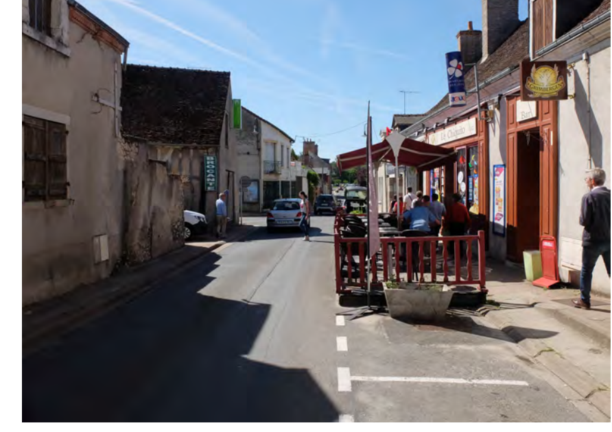
Une initiative pour occuper l'espace public en implantant une terrasse sur les places de stationnement