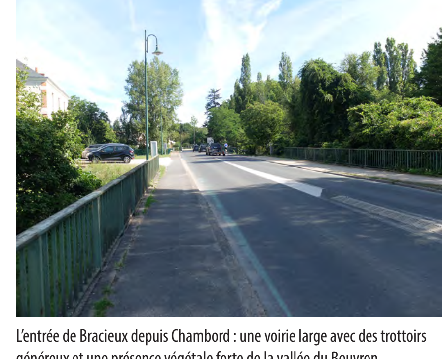
L'entrée de Bracieux depuis Chambord : une voirie large avec des trottoirs généreux et une présence végétale forte de la vallée du Beuvron