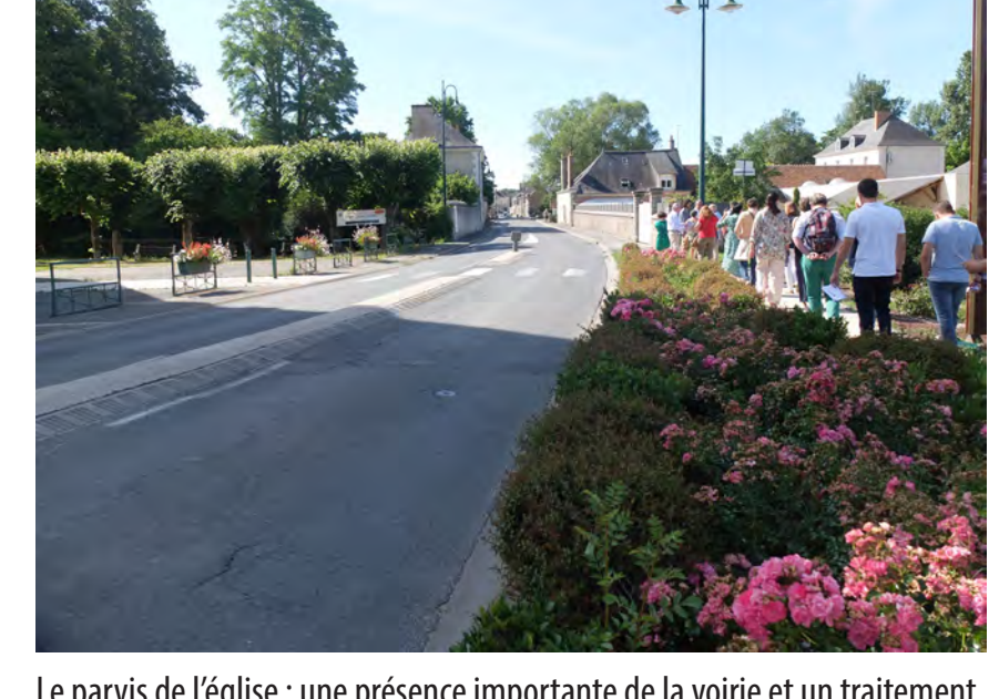
Le parvis de l'église : une présence importante de la voirie et un traitement paysager peu qualitatif; bandes plantées fragmentant l'espace