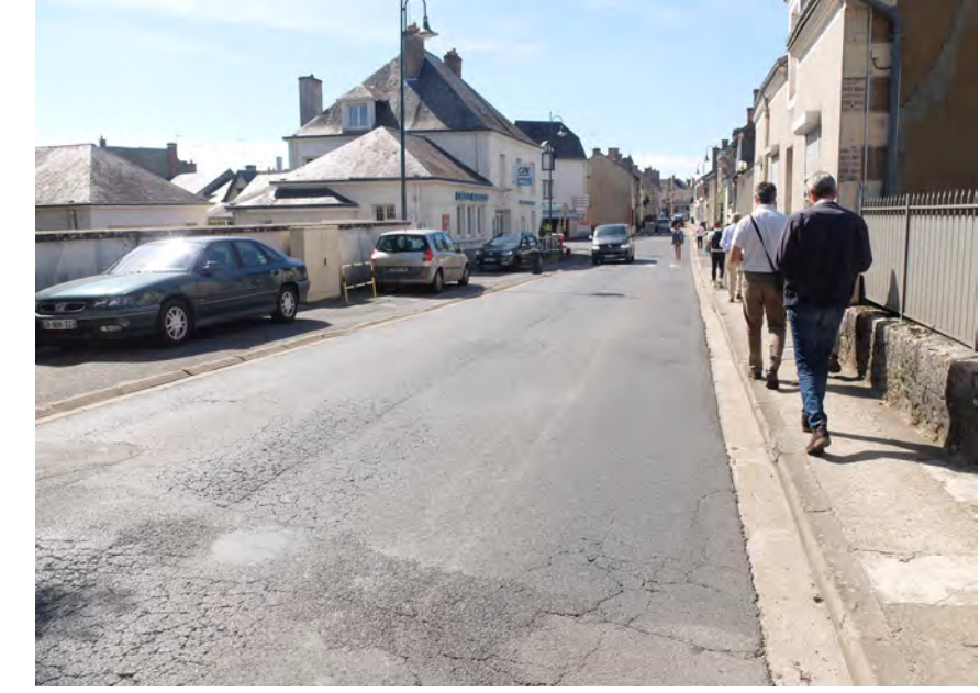
Élargissement de l'emprise au niveau du Crédit Agricole, mais occupé par du stationnement