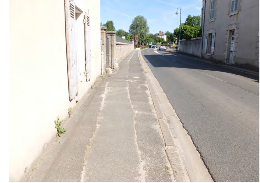
Au niveau du presbytère, une présence importante de murs longeant la voirie accentuant l'effet couloir et une faible visibilité du presbytère par manque de recul et de dégagement au pied du bâtiment