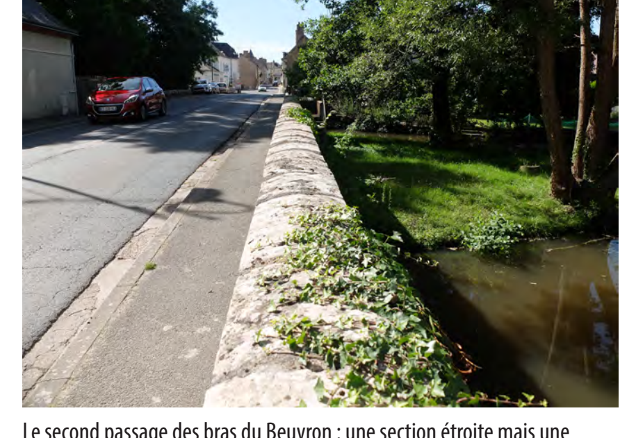
Le second passage des bras du Beuvron : une section étroite mais une qualité d'ambiance avec le bruit de l'eau et la présence de beaux arbres