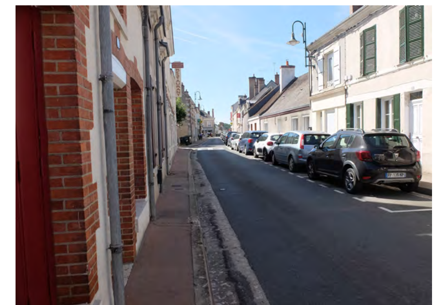
La rue commerçante : une séquence urbaine, marquée par son cadre bâti et son activité, souffrant d'un espace public peu attractif : stationnement, étroitesse des trottoirs