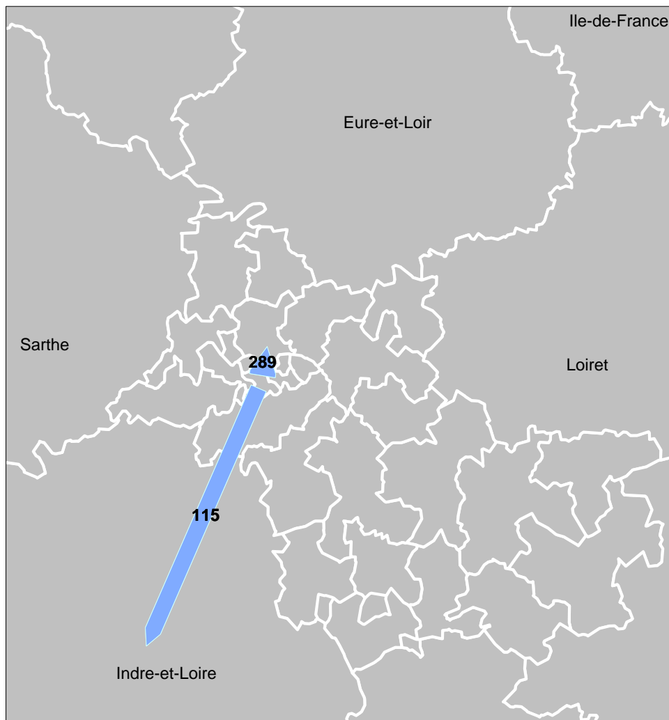
Principaux flux de sortants