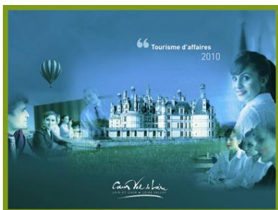
Brochure Tourisme d'affaires 2010