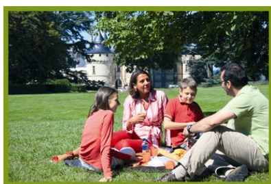
Développement de l'offre famille

→ Les familles constituent la 1 ère clientèle du département, elles représentent plus de 40 % des visiteurs