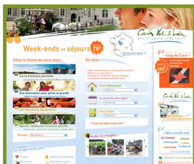
Site dédié aux séjours